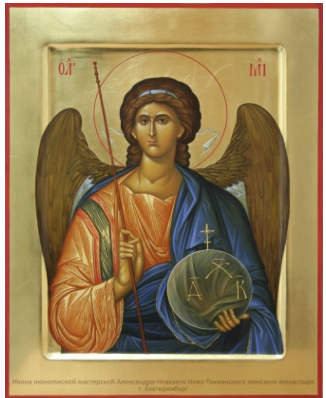
Икона иконописной мастерской Александро-Невского Ново-Тихвинского женского монастыря г. Екатеринбург