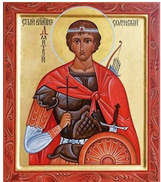
Великомученик Димитрій Мироточець The Great - Martyr Demetrius 26.X